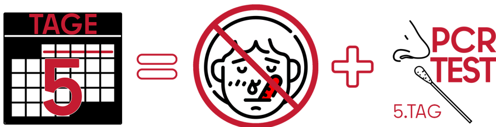
Abbildung 2: Sie sind vollständig geimpft. Das bedeutet, dass Sie zwei Impfungen erhalten haben. Die letzte Impfung haben Sie vor mehr als zwei Wochen erhalten. Wenn Sie nie Beschwerden hatten und sich auch jetzt gesund fühlen, können Sie am 5. Tag einen PCR-Test machen. Wenn das Ergebnis negativ ist, ist die Quarantäne zu Ende. Ansonsten müssen Sie 14 Tage in Quarantäne bleiben.