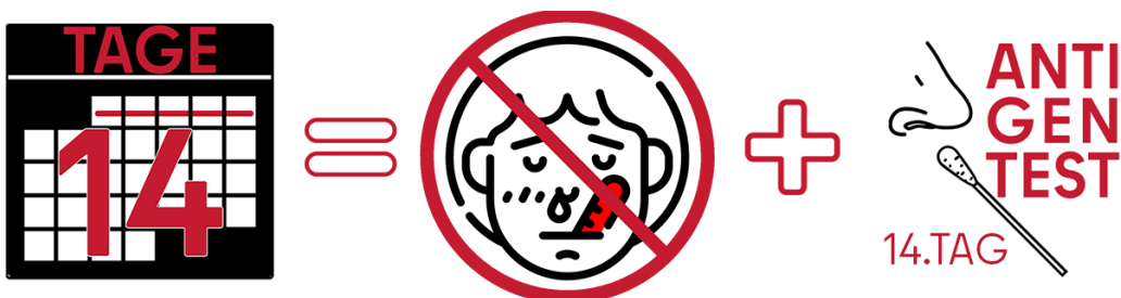
Abbildung 3: Wenn Sie am 13. und am 14. Tag gesund fühlen, können Sie am 14. Tag einem Antigen-Schnelltest machen. Wenn das Ergebnis negativ ist, ist die Quarantäne zu Ende. Ansonsten müssen Sie nochmals 5 Tage in Quarantäne bleiben.